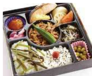
焼肉幕の内御膳 ～寅次郎流～ 商品番号-1271 834 円 (税別)

ざくっと噛み切れて、脂身がジュワッとした口の中で溶けるような感覚をお楽しみ頂けるよう少し厚くカットしております。