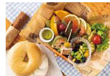
ピクニックボックス ～炙りサーモンとピンチョスのテリスタイル～

マフィンやブラウニー、タルトにムース、季節のフルーツをふんだんに盛り込んだ、バスケットに、自慢のベーグルとスティックタイプのチョコレートブラウニーをお届け。午後の穏やかなひと時に、コーヒーや紅茶と合わせてお楽しみいただけるよう仕立てました。