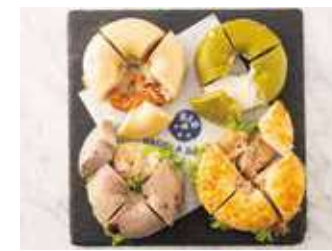
BAGELパーティープレート16 2,860 (税別) 円

サーモン&クリームチーズプレーン1/4 エビとアボカドワイルドブルーベリー1/4 抹茶ホワイトチョコクリームチーズ1/4 ごぼう焙煎ゴマサラダとチキンヴォルケーノ1/4 ※4種のベーグル×4カット