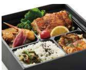
寅次郎の地鶏「匠」焼き鳥弁当 ～寅次郎流～ 商品番号-19095 2,130 円 (税別)

特選黒毛和牛の牛肉すき焼き弁当。定番でありながら玉子・タレ・付け合せにも寅次郎らしさを。