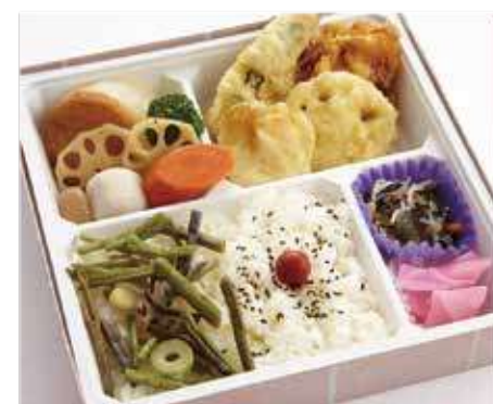
季節の旬野菜天ぷら御膳 ～寅次郎流～