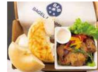
【ランチBOX】プレーン&ヴォルケーノ (グリルチキン) 950円 (税別)

プレーンクリームチーズ、季節のフルーツ、グリーンカール、赤パプリカ、黄パプリカ、ドレッシング、有機人参 & 有機オレンジジュース