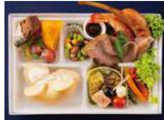
【ミーティングBOX】プレーン クリームチーズ(バラエティストイル) 1,590 (税別) 円

チキンやカツ、ロースとハムとベーグルと相性抜群のお肉料理を贅沢にも盛り込んだ特製のランチボックスです。お野菜やフルーツ、デザートまで付いた、ヘルシーでボリューム満点なひと箱に仕立てました。