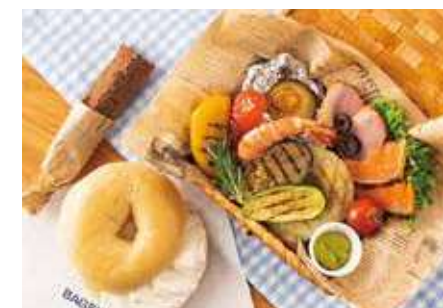
ピクニックボックス ～たっぷりグリル野菜のパラエティスタイル～

きれいなピンク色のサーモンと、かわいらしいピンチョスを中心に、ビーツとりんごのさらだなど彩豊かなボックスです。自慢のベーグルはもちろん、スティックタイプのチョコレートブラウニーが、セントラルパークでピクニックをしているような気分を演出します。