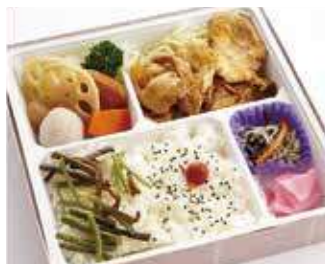
特選豚焼肉御膳 ～寅次郎流～ 商品番号-6085 732 円 (税別)

甘辛特製ダレが食欲を刺激する特製豚焼肉をたっぷり詰め込みました。シャキシャキ食感のキャベツはお肉とも相性抜群。大満足の一品です。