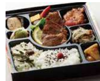
特上霜降りカルビ幕の内御膳 ～寅次郎流～ 商品番号-1846 834 円 (税別)

お肉も野菜もバランスよく、おなかいっぱいお召し上がり頂ける自慢の一品です。こってり味の牛焼肉と上品な味わいの京風煮物です。