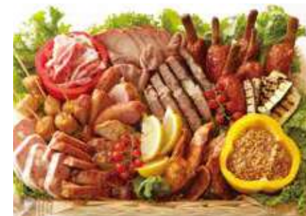
ミートスタイルバスケット 12,480 (税別) 円

パーティーといえば『これ！』弊社のすべりが詰まった、ピンチョスバスケットを是非お試しください！