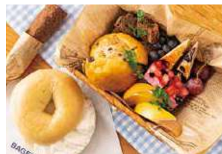
ピクニックボックス ～贅沢8種のスイーツスタイル～