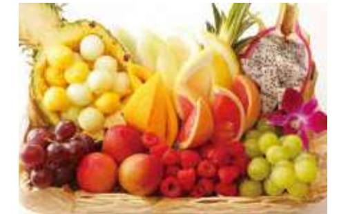
フルーツバスケット 13,520 (税別) 円

野菜ソムリエが厳選した四季折々の野菜をバスケット仕立てのパーニャカウダに致しました。パーニャカウダソースで召し上がるのもよしそのまま召し上がるのもよし！野菜不足な方には特におすすめです！！