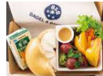
【ランチBOX】プレーン (フルーツ)+有機人参&オレンジ 880円 (税別)

プレーンクリームチーズ、サーモン、グリーンカール、赤パプリカ、黄パプリカ、ドレッシング、有機人参 & 有機オレンジジュース