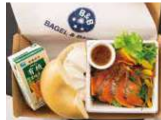
【ランチBOX】プレーン (炙りサーモン)+有機人参&オレンジ 860円 (税別)

プレーンクリームチーズ、サーモン、グリーンカール、赤パプリカ、黄パプリカ、ドレッシング、有機人参 & 有機オレンジジュース