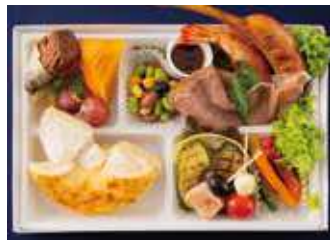
【ミーティングBOX】ヴォルケーノ クリームチーズ(バラエティストイル) 1,850 (税別) 円

焦がしチーズのヴォルケーノクリームチーズがメインのミートスタイルBOXです。チキンやカツ、ロースとハムとベーグルと相性抜群のお肉料理が堪能できる一箱に仕上げました。