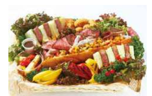
国産高級ビーフサンド バスケット 15,000 (税別) 円

ドライフルーツやチーズをふんだんにバスケットに詰め込みました。ワイン等好きなドリンクとご一緒にお楽しみください。