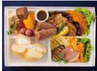
【ミーティングBOX】プレーン クリームチーズ(ミートスタイル) 1,580 (税別) 円

チキンやカツ、ロースとハムとベーグルと相性抜群のお肉料理を贅沢にも盛り込んだ特製のランチボックスです。お野菜やフルーツ、デザートまで付いた、ヘルシーでボリューム満点なひと箱に仕立てました。