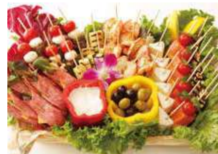
ピンチョスバスケット 13,520 (税別) 円

提携店のBAGEL&BAGELより、選りすぐりのベーグル達！しっとりモチモチなベーグルは老若男女に喜ばれます！様々なシーンにご活用ください。