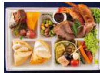
【ミーティングBOX】プレーンメイプル クリームチーズ&ヴォルケーノクリームチーズ (バラエティストイル) 2,200 (税別) 円

プレーンメイプルとヴォルケーノクリームチーズがセットになったミートスタイルBOXです。お肉メインのラインナップなので、ヘルシーでボリューム満点なひと箱に仕上げました。