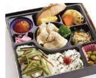
煎り胡麻 豚しゃぶ幕の内御膳 ～寅次郎流～ 商品番号-6902 834 円 (税別)

マスコミ人気もなるほどという、職人技が光るお弁当になっても美味しい天ぷらと、6種の副菜を詰めた特製御膳です。