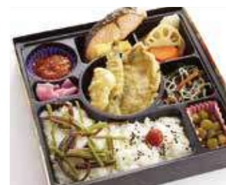
特選季節の旬野菜天ぷら幕の内御膳 ～寅次郎流～ 商品番号-6901 834 円 (税別)

マスコミ人気もなるほどという、職人技が光るお弁当になっても美味しい天ぷらと、6種の副菜を詰めた特製御膳です。