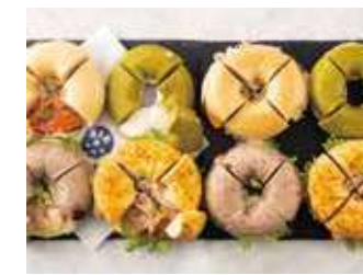
BAGELパーティープレート32 5,720 (税別) 円

サーモン&クリームチーズプレーン1/4 エビとアボカドワイルドブルーベリー1/4 抹茶ホワイトチョコクリームチーズ1/4 ごぼう焙煎ゴマサラダとチキンヴォルケーノ1/4 ※4種のベーグル×4カット