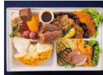
【ミーティングBOX】ヴォルケーノ クリームチーズ(ミートスタイル) 1,750 (税別) 円

シーフードのうまみがたっぷり詰まった、海辺のテラスでいただくようなランチボックスです。お野菜やフルーツ、デザートまで付いた、ヘルシーでボリューム満点なひと箱に仕立てました。