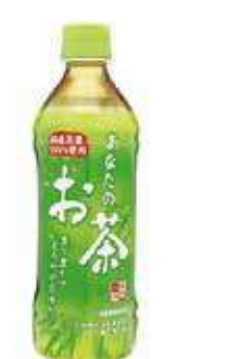
ペットボトル緑茶 500ml 186 円 (税別)

シンプルだからこそ際立つ素材の味！！和牛を1枚1枚、大きさ・厚みを見ながら、塩加減を調節する熟練の職人による味付けで仕上げられています。