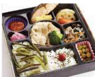
特選豚塩だれ炒め幕の内御膳 ～寅次郎流～ 商品番号-6093 834 円 (税別)

料理長おすすめ・香ばしいゴマの香りが食欲を刺激する豚しゃぶ御膳をお届けいたします。豚バラ肉をたっぷり使った贅沢な一品です。