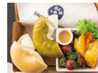
【ランチBOX】プレーン&抹茶ホワイト (フルーツ) 1,100円 (税別)

プレーンクリームチーズ1/2、ブルーベリークリームチーズ1/2、季節のフルーツ、グリーンカール、赤パプリカ、黄パプリカ、ドレッシング