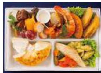
【ミーティングBOX】ヴォルケーノ クリームチーズ(シーフードスタイル) 1,950 (税別) 円

焦がしチーズのヴォルケーノクリームチーズがメインのバラエティストイルBOXです。色とりどりのピンチョスや、お肉にシーフードを集めたバラエティ豊かな贅沢な一箱に仕上げました。