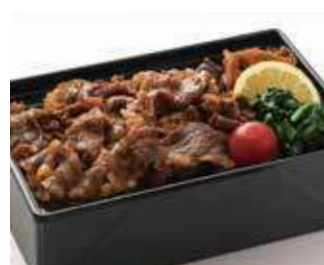
こだわり銘柄豚使用豚カルビめし ～寅次郎流～ 商品番号-19092 1,500 円 (税別)

濃厚なうま味の豚バラ肉を秘伝の塩だれで味付けしたボリューム感のある一品です。優しい味わいの煮物など箸休めも充実。