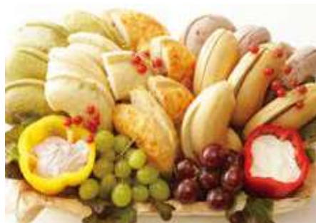
ベーグルバスケット 12,000 (税別) 円

提携店のBAGEL&BAGELより、選りすぐりのベーグル達！しっとりモチモチなベーグルは老若男女に喜ばれます！様々なシーンにご活用ください。