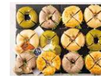
BAGELパーティープレート48 8,580 (税別) 円

サーモン&クリームチーズプレーン1/4 エビとアボカドワイルドブルーベリー1/4 抹茶ホワイトチョコクリームチーズ1/4 ごぼう焙煎ゴマサラダとチキンヴォルケーノ1/4 ※4種のベーグル×8カット