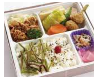
焼肉と京風煮物御膳 ～寅次郎流～ 商品番号-6087 732 円 (税別)

ふっくらジューシーな鶏肉をお弁当の大定量の照り焼きに仕上げました。香ばしい特製ダレとお肉のうまみがベストマッチ。