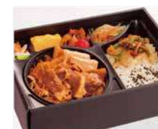
特選黒毛和牛すき焼き弁当 ～寅次郎流～ 商品番号-19094 2,130 円 (税別)

黒毛和牛を贅沢に使った肉ざんまいの牛めし。黒毛和牛を贅沢に使用したアツアツのボリューム満点牛めし。