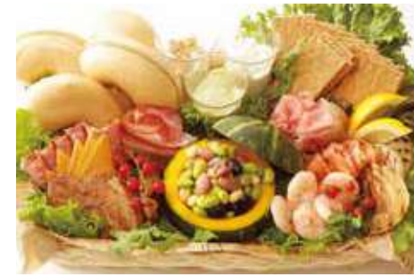
ベーグルディップスタイル バスケット 14,400 (税別) 円

ベーグルをアボカドディップ、ブルーベリーディップ、クリームチーズディップでお楽しみいただけます。様々な食材を選んで、オンリーワンなサンドイッチを作ってみてはいかがでしょうか？