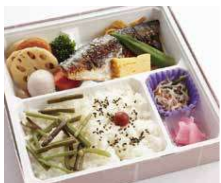
サバの味噌焼き御膳 ～寅次郎流～

ほろりとほぐれるやわらかな鯖をシンプルな塩焼きで仕上げました。ヘルシーでバランスよくお召し上がり頂ける逸品です。