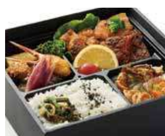
至宝の一折 特上幕の内御膳 ～寅次郎流～ 商品番号-19096 2,593 円 (税別)

秘伝のタレをふんだんにつけて焼き上げた、さっぱりすっきりとした味わいの焼き鳥弁当。