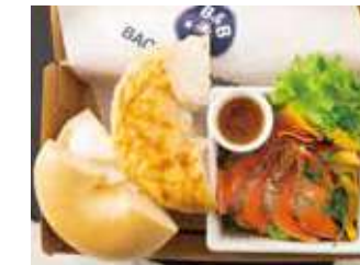
【ランチBOX】プレーン&ヴォルケーノ (炙りサーモン) 980円 (税別)

プレーンクリームチーズ1/2、ヴォルケーノクリームチーズ1/2、グリルチキン45g、グリーンカール、赤パプリカ、黄パプリカ、ドレッシング