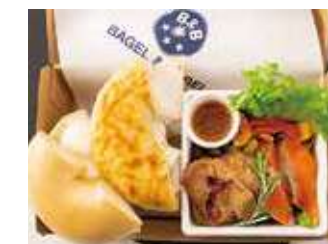
【ランチBOX】プレーン&ヴォルケーノ (グリルチキン&炙りサーモン) 1,200円 (税別)

プレーンクリームチーズ1/2、抹茶ホワイトチョコメイプルクリーム1/2、季節のフルーツ、グリーンカール、赤パプリカ、黄パプリカ、ドレッシング