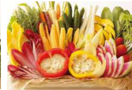
パーニャカウダバスケット 12,600 (税別) 円

ベーグルをアボカドディップ、ブルーベリーディップ、クリームチーズディップでお楽しみいただけます。様々な食材を選んで、オンリーワンなサンドイッチを作ってみてはいかがでしょうか？