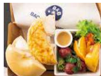
【ランチBOX】プレーン&ヴォルケーノ (フルーツ) 1,000円 (税別)

プレーンクリームチーズ1/2、ヴォルケーノクリームチーズ1/2、サーモン、グリーンカール、赤パプリカ、黄パプリカ、ドレッシング