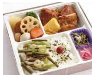
照焼きジューシー鶏御膳 ～寅次郎流～ 商品番号-6086 732 円 (税別)

甘辛特製ダレが食欲を刺激する特製豚焼肉をたっぷり詰め込みました。シャキシャキ食感のキャベツはお肉とも相性抜群。大満足の一品です。