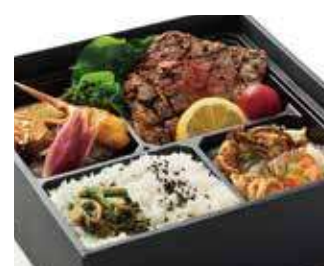
特選黒毛和牛塩レモンステーキ弁当 ～寅次郎流～ 商品番号-19097 2,593 円 (税別)

グリルから焼き上がる高品質の牛・豚・鶏を最高の状態で食す、「贅沢の極み」弁当。寅次郎がこだわった牛・豚・地鶏を全て楽しむ事が出来る至宝の一折です。