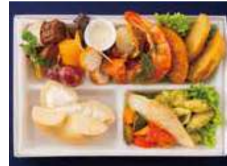
【ミーティングBOX】プレーン クリームチーズ(シーフードスタイル) 1,650 (税別) 円

色とりどりのピンチョスや、お肉にシーフード、まるでパーティー料理を取り分けたように豪華なランチボックスです。お野菜やフルーツ、デザートまで付いた、ヘルシーでボリューム満点なひと箱に仕立てました。