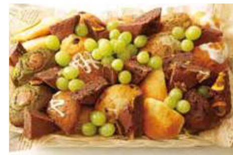
スイーツバスケット 12,800 (税別) 円

パーニャカウダと並ぶ、当店一押し商品！パーティーだけでなく記念日や贈り物としても喜ばれます！