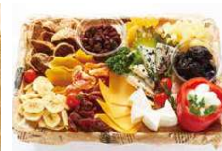
ドライフルーツ&チーズ バスケット 7,500 (税別) 円

提携店のBAGEL&BAGEL厳選のスイーツバスケット！やはり、しっとりもちもちな食感で類をみない美味しさです。