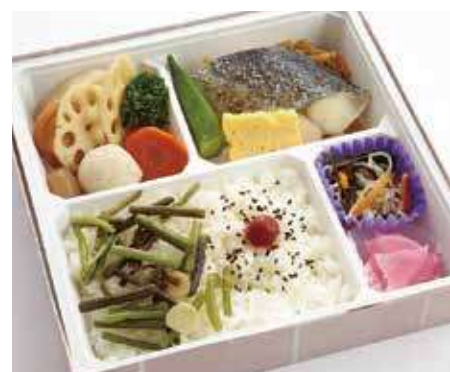
鯖の塩焼き御膳 ～寅次郎流～

職人技が光る一品。お弁当になっても美味しい天ぷらの御膳です。ほっとする味付けの煮物や副菜を詰め合わせました。