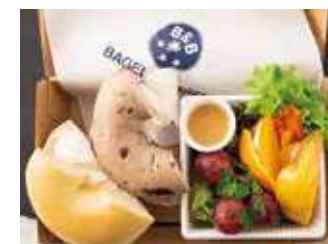
【ランチBOX】プレーン&ブルーベリー (フルーツ) 1,000円 (税別)

プレーンクリームチーズ1/2、ヴォルケーノクリームチーズ1/2、季節のフルーツ、グリーンカール、赤パプリカ、黄パプリカ、ドレッシング