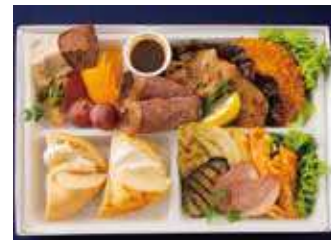
【ミーティングBOX】プレーンメイプル クリームチーズ&ヴォルケーノクリームチーズ (ミートスタイル) 2,100 (税別) 円

焦がしチーズのヴォルケーノクリームチーズがメインのシーフードスタイルBOXです。シーフードのうまみがたっぷり詰まった、ヘルシーでボリューム満点なひと箱に仕上げました。