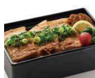
肉ざんまい 特選黒毛和牛 牛めし ～寅次郎流～ 商品番号-19093 1,806 円 (税別)

最高級の国産銘柄豚を使用し、寅次郎独自の豚カルビ専用タレでジューシーに焼き上げています。