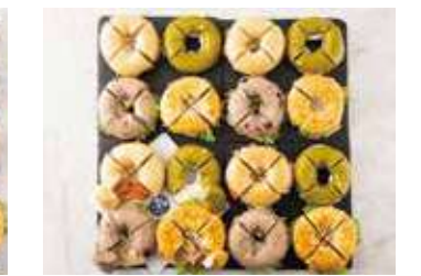
BAGELパーティープレート64 11,440 (税別) 円

サーモン&クリームチーズプレーン1/4 エビとアボカドワイルドブルーベリー1/4 抹茶ホワイトチョコクリームチーズ1/4 ごぼう焙煎ゴマサラダとチキンヴォルケーノ1/4 ※4種のベーグル×12カット