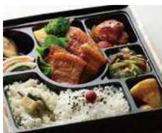
豚カルビ濃厚タレ焼き幕の内御膳 ～寅次郎流～ 商品番号-1069 834 円 (税別)

牛カルビとサンチュは焼肉弁当の決定版。サンチュに牛カルビとご飯をくるんで食べればロケ弁当の常識が変わります。