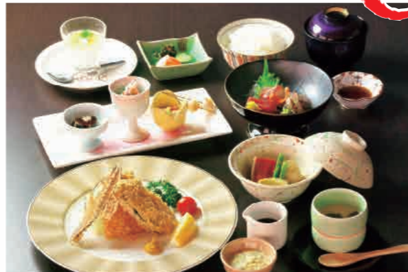
料理イメージ オプション(別途有料)で、「 蝦夷あわびの踊り酒蒸し 」をお付けすることができます。