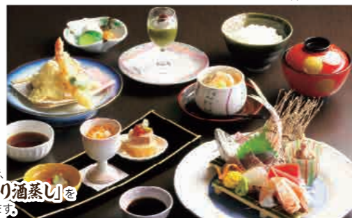
オプション(別途有料)で、「 蝦夷あわびの踊り酒蒸し 」をお付けすることができます。